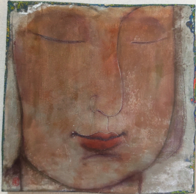
Regard sur l'héritage - LiYan ZHU Peinture à la laque sur tissu lin 18x18cm, 2020