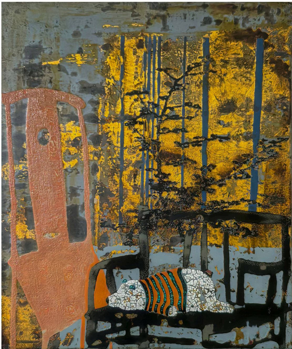
L'ombre des fleurs frôle la fenêtre - Shi QIU Peinture à la laque sur bois, feuille d'or, coquille d'oeuf