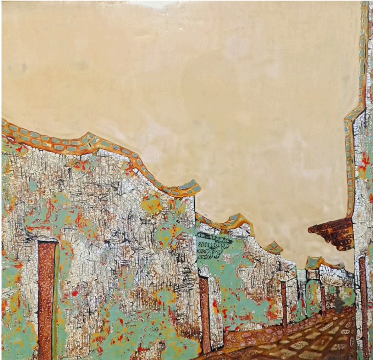
Les ruelles traditionnelles de Fuzhou I - XiaoDong SUN Peinture à la laque, coquille d'oeuf 40x40cm, 2020