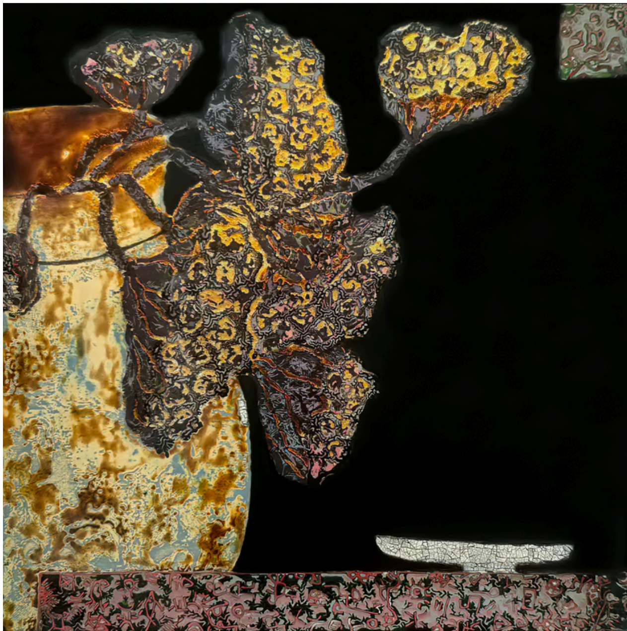
Serenité éternelle - Yan JIN Peinture à la laque sur bois, feuille d'or, coquille d'oeuf