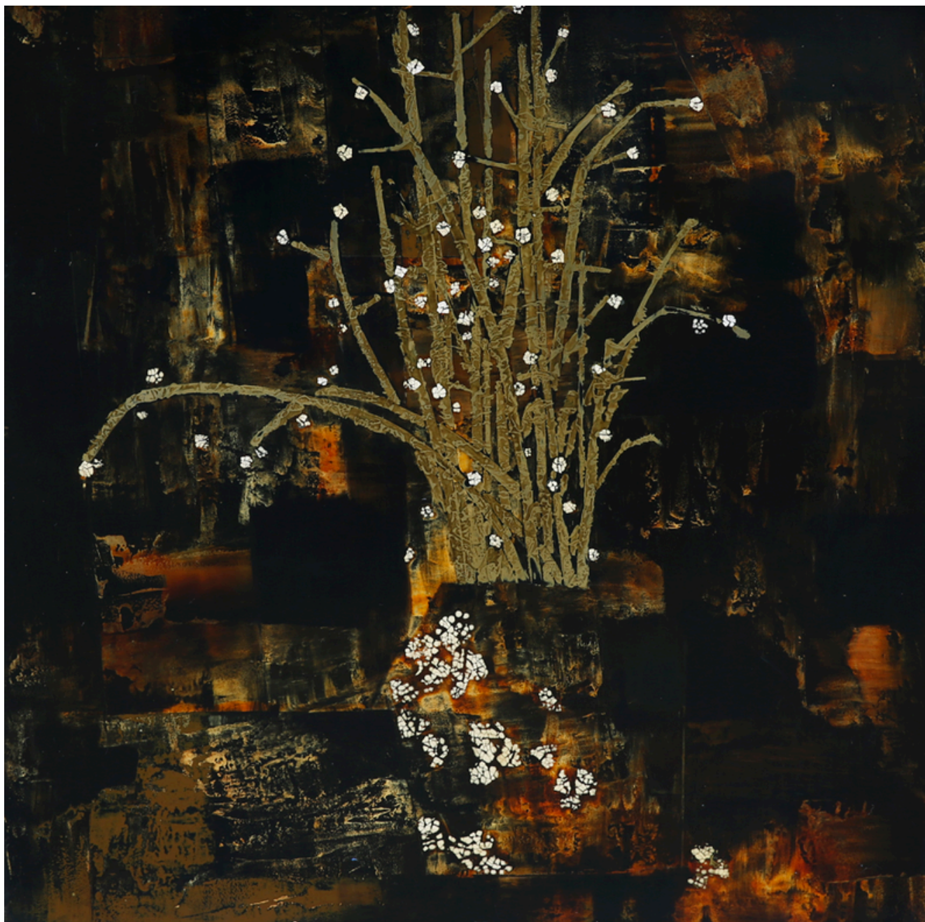
Fruits d'automne - Shi QIU Peinture à la laque sur bois, feuille d'or, coquille d'oeuf