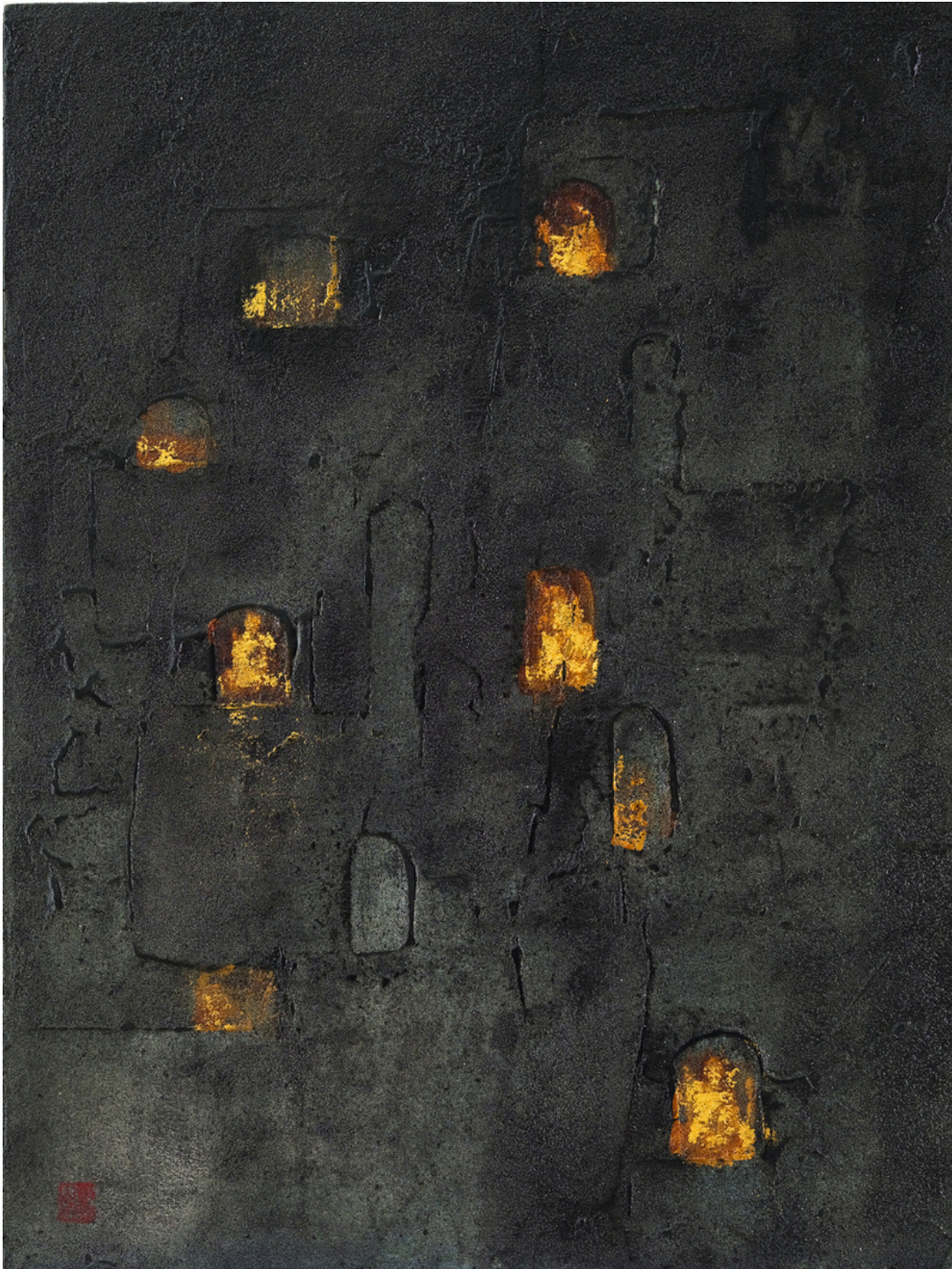
Splendeur des mille formes - XueShanLIU Peinture à la laque, feuille d'or 30x40cm, 2024