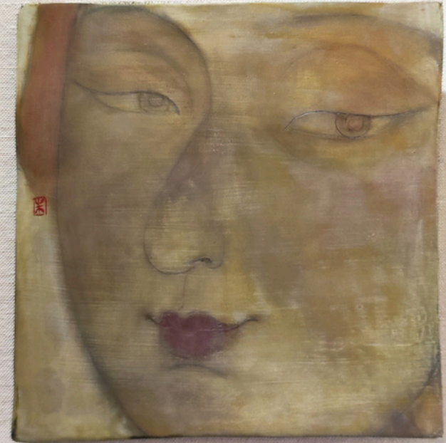
Retour sur le passé - LiYan ZHU Peinture à la laque sur tissu lin 18x18cm, 2020