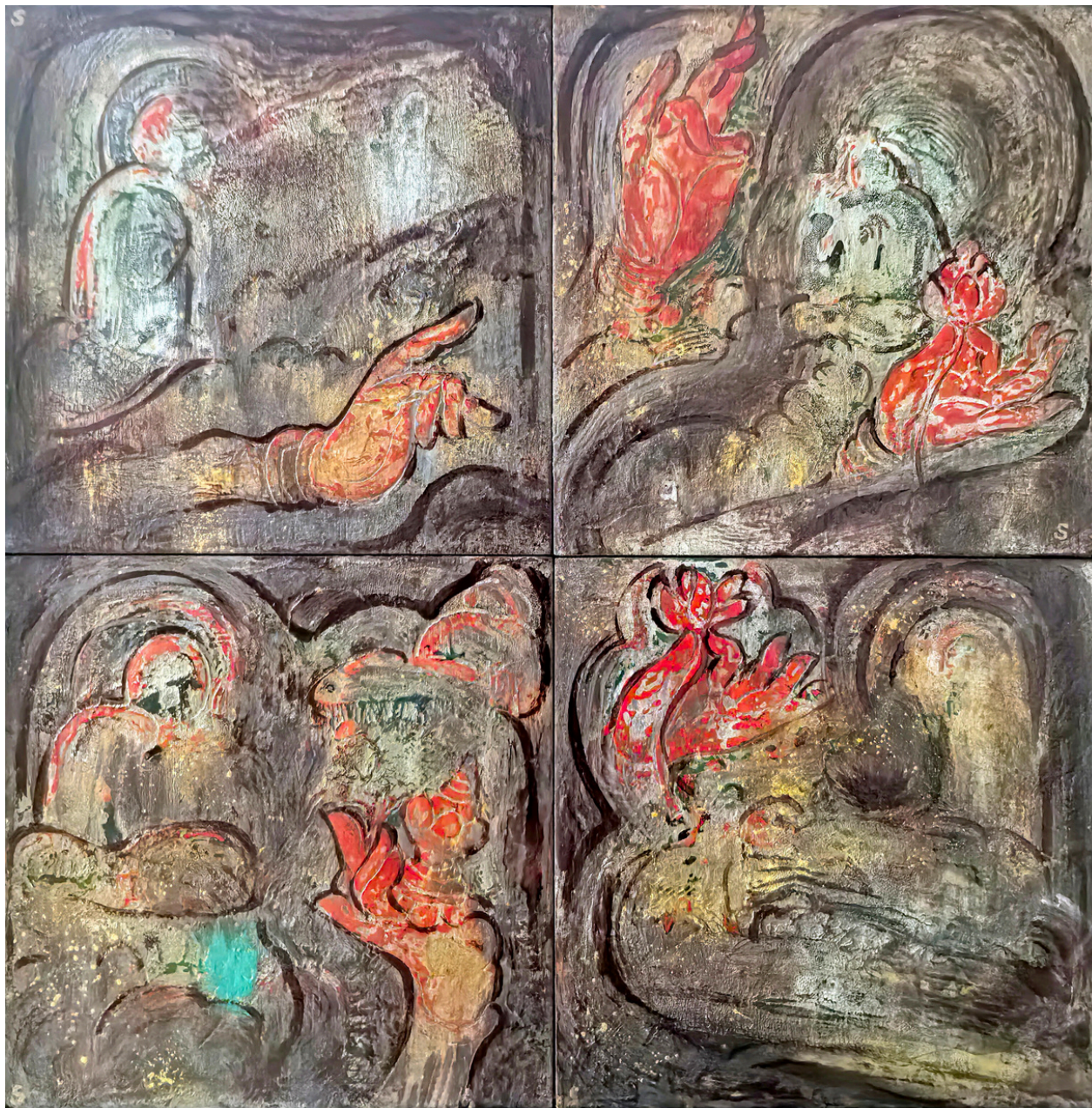
Le mystère de la forêt - ShiShi XIANG Peinture à la laque sur bois 40x40cm, 2022