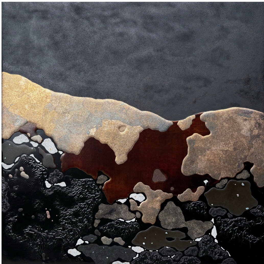
Vide sublime - JiTang MA Peinture à la laque, feuille d'or 40x40cm, 2020