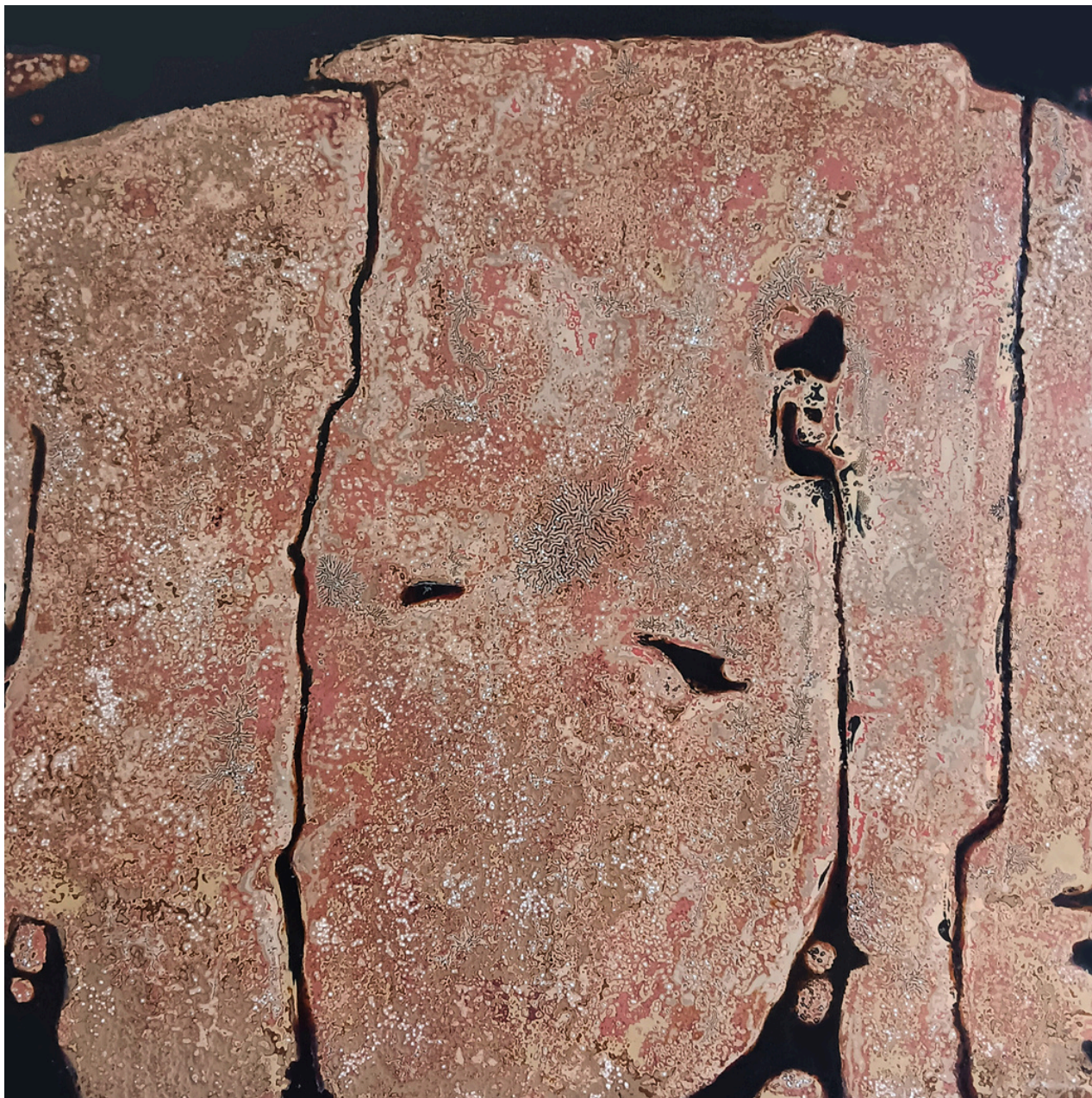
À la rencontre de Mawangdui I - XunChun XIE Peinture à la laque sur bois